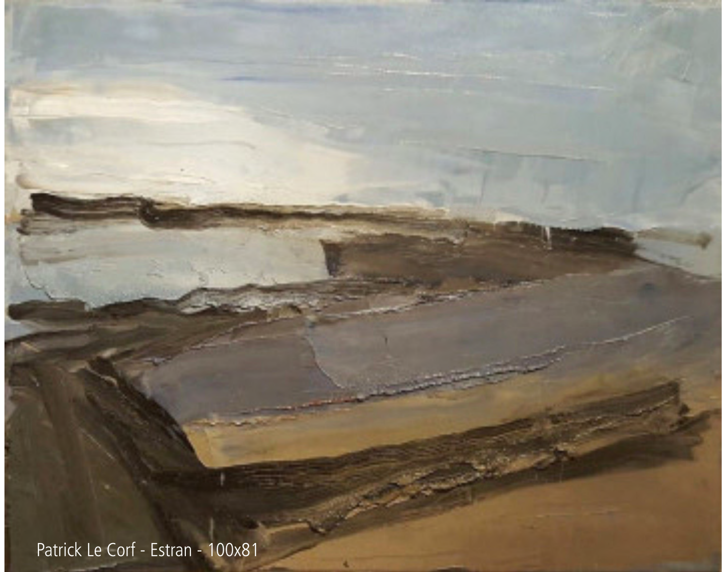
Patrick Le Corf - Estran - 100x81