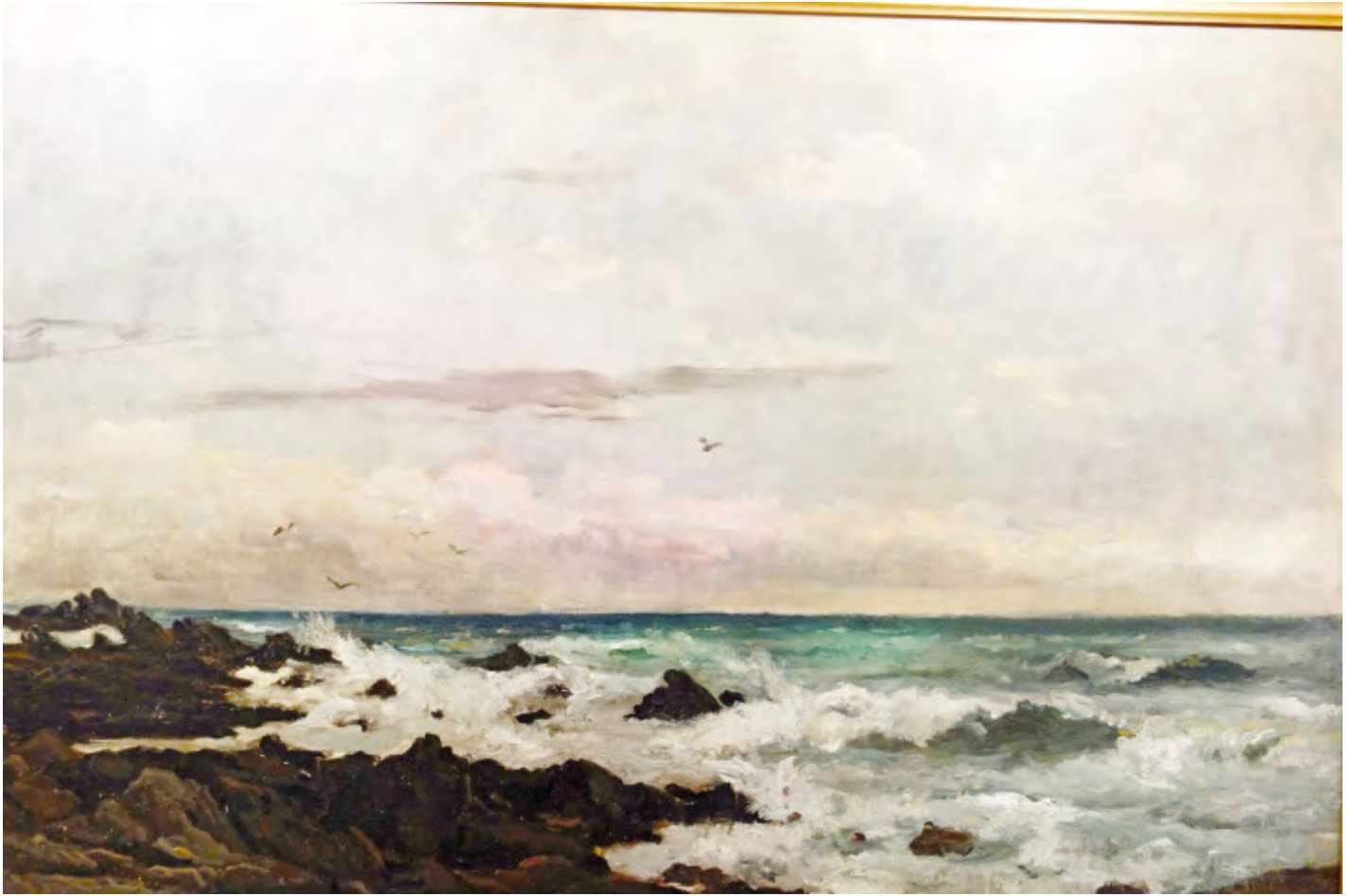
Karl Daubigny, Côtes rocheuses à Penmarc'h

du ciel. Cette Normandie est un terrain d'expérimentation pour les artistes qui se côtoient et échangent leurs impressions et leurs techniques dans une véritable émulation intellectuelle .