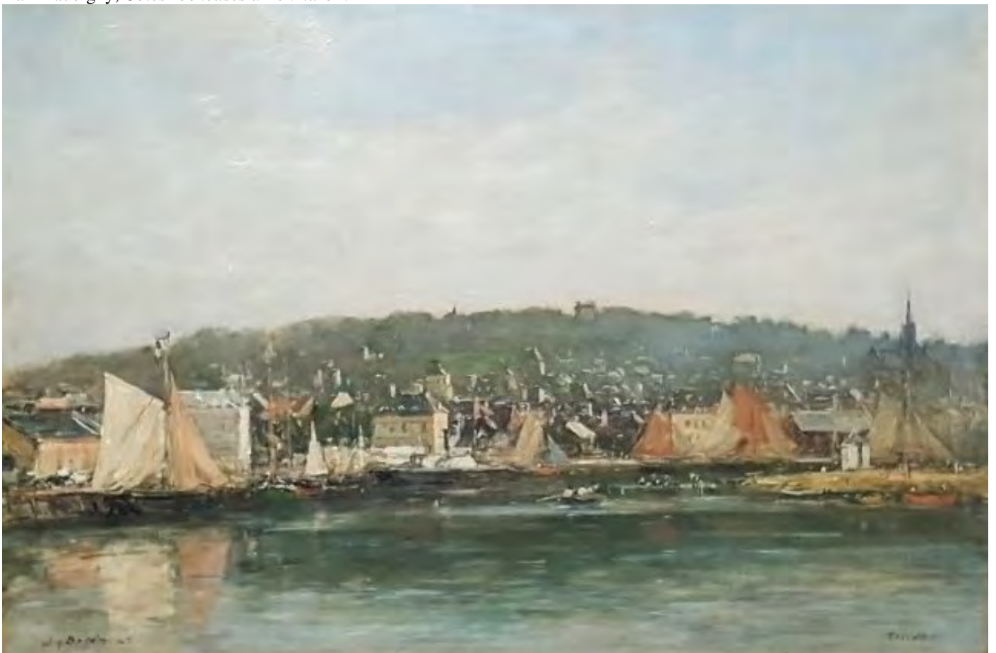
Eugène Boudin, Le Port de Trouville le matin (1888, Musée des Beaux-Arts de Reims)